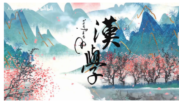
（图为学生记者制作的第七届世界汉学大会闭幕式视频《Bonjour! 汉学》）

红”；当“烟雨江南”邂逅“日光之城”；当“中国巨龙”携手“高卢雄鸡”，在融通中外文化、增进文明交流之中，真实、立体、全面的中国图景向世界徐徐展开。