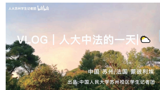
（图为学生记者团制作的苏州校区首部校园vlog《人大中法的一天》）

的故事，展现了人大人“始终奋进在时代前列”的青春面貌。在中法学院成立十周年之际，我们创办了“湖畔思语”专栏，分享校区师生的爱校之情、报国之志，展现了人大青年对祖国血浓于水、与人民同呼吸共命运的青春形象。“青春向党、不负人民”“复兴栋梁、强国先锋”，不仅仅是嘹亮口号，更是铮铮誓言。内化于心，外化于行，人大学子在实现中华民族伟大复兴的时代洪流中踔厉奋发、勇毅前进，在青春的赛道上留下了奋力奔跑的模样。