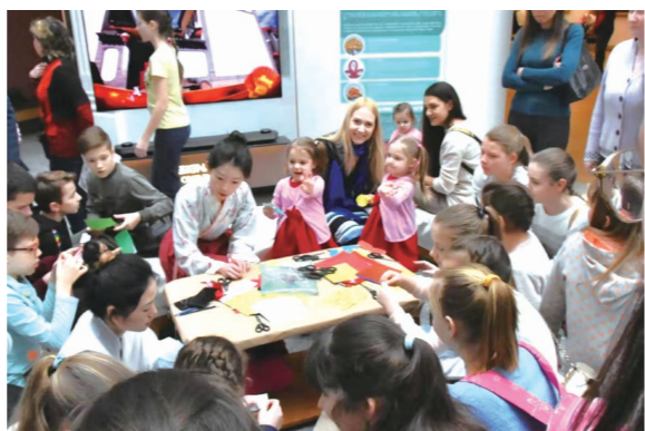
汉语国际教育专业学生在白俄罗斯国家美术馆“欢乐春节”系列活动中展示剪纸与书法

用内心感应时代脉搏，要回答好“世界怎么了”、“人类向何处去”的时代之题。放眼今日，世界百年未有之大变局加速演进，世界进入新的动荡变革期，因此我们更应有意地从祖国丰富的历史文化中来，从人类命运共同体的伟大探索和实践而来，不断推进中华优秀传统文化的创造性转化和创新性发展，借汉语国际教育的课堂向世界共享中国之路、中国之治、中国之理，为人类共同的发展尽职尽责，贡献一份青春的力量。